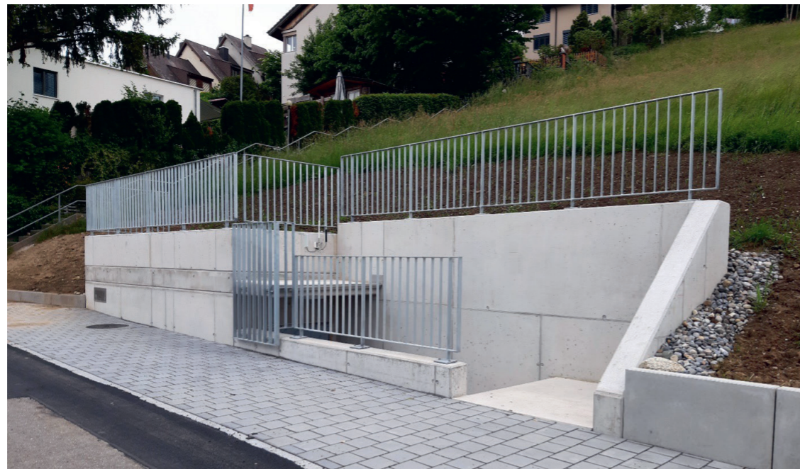
Mit diesem Bauwerk, welches die Personalkorporation Root erstellte, konnte der Wasserverbund zwischen Root und Gisikon im April 2023 erfolgreich in Betrieb genommen werden.

*Die Nettoschuld pro Einwohner/in zeigt die Pro-Kopf-Verschuldung nach Abzug des Finanzvermögens. Die Nettoschuld soll gemäss Verordnung über den Finanzhaushalt der Gemeinden CHF 2'500 nicht übersteigen. Negative Werte bedeuten, dass eine Gemeinde ein Nettovermögen hat und somit keine Nettoschulden aufweist.