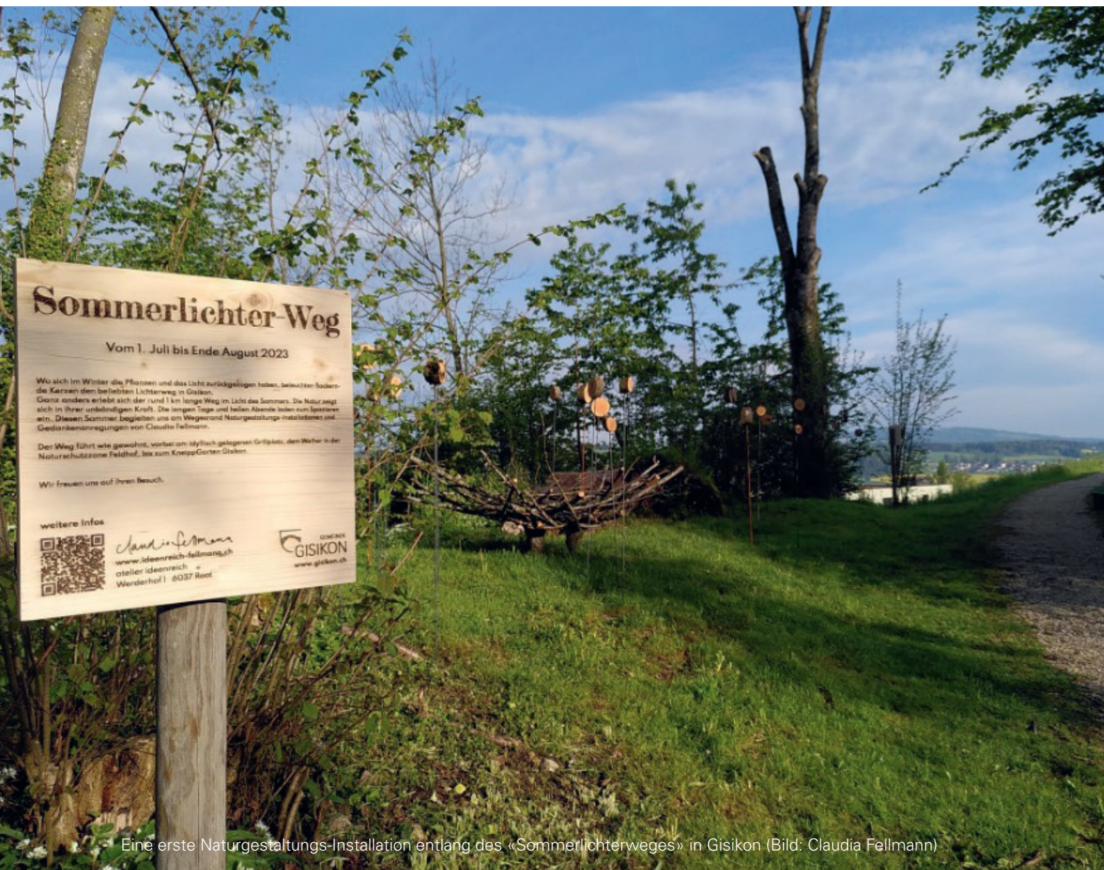
Eine erste Naturgestaltungs-Installation entlang des «Sommerlichterweges» in GIsikon

Mittwoch, 21. Juni 2023, 20.00 Uhr, im Zentrum Mühlehof