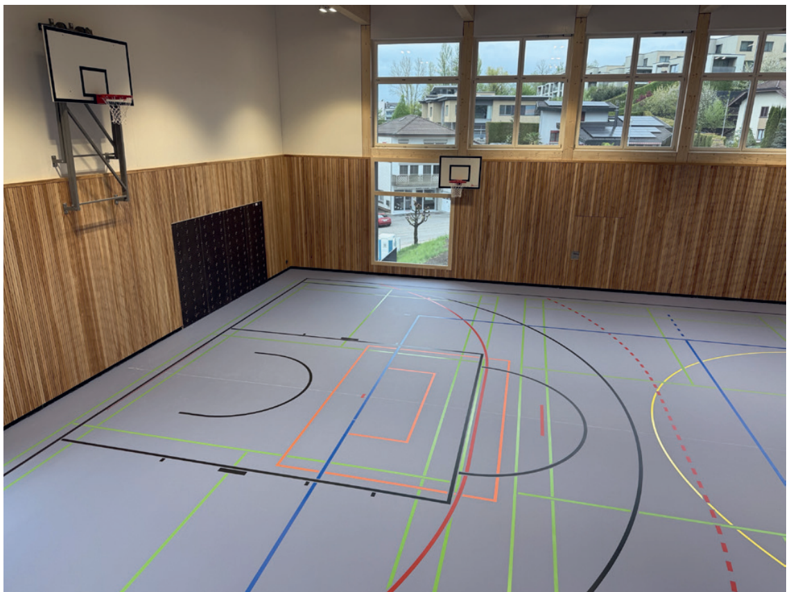
Innenraum Sporthalle

Folgende Projekte bzw. Investitionen konnten abgeschlossen werden: Erste Phase der Digitalisierung, Generelle Wasserversorgungsplan (GWP) Zustandserfassung, Hydranten-Verlegung beim Schulhaus, Umbau der Tagesstruktur, Anpassungen beim Schulraum für eine weitere Klasse sowie die Schutzraum-aufhebung beim Gemeindehaus. Zudem wurden erste Abklärungen für die Dorfkernentwicklung getätigt.